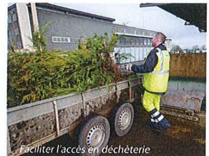
Faciliter l'accès en déchèterie