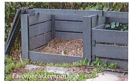
Favoriser le compostage