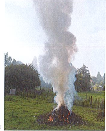
Brûlage effectué par des particuliers

Dans la région Hauts-de-France, la pollution de l'air par les particules fines (PM2.5) est à l'origine de 6 500 décès prématurés par an (source: Santé Publique France, 2016).